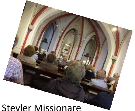
Kennenlernen der Missionsstätte der Steyler Missionare und ein gemeinsamer Gottesdienst