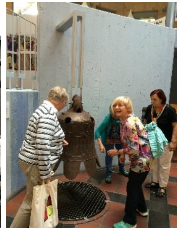
Stadtführung durch Aachen und Besichtigung von missio Aachen