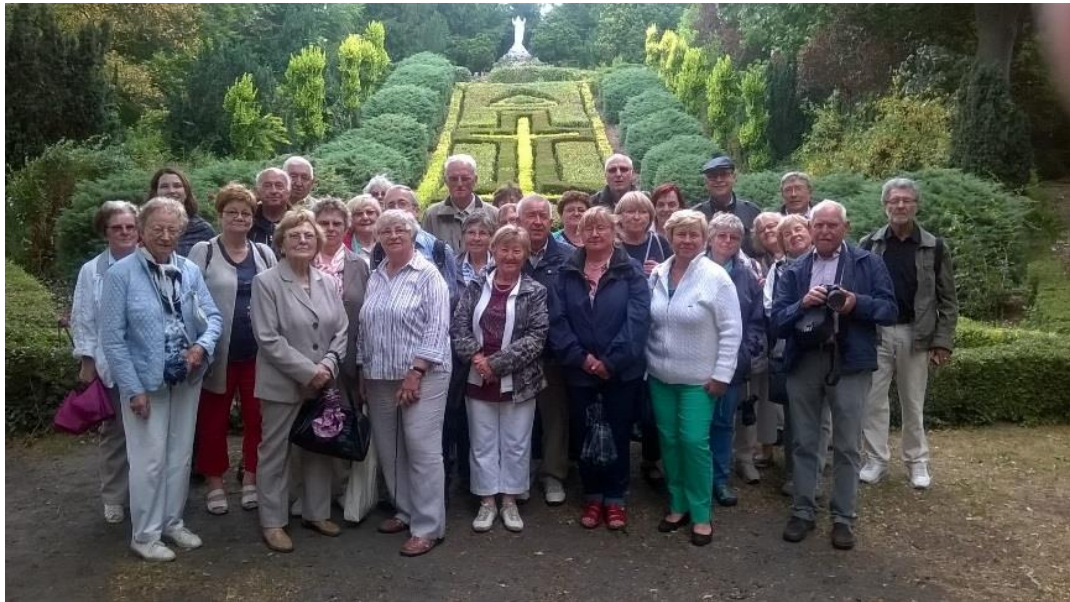
Gruppenfoto im Steyler Park