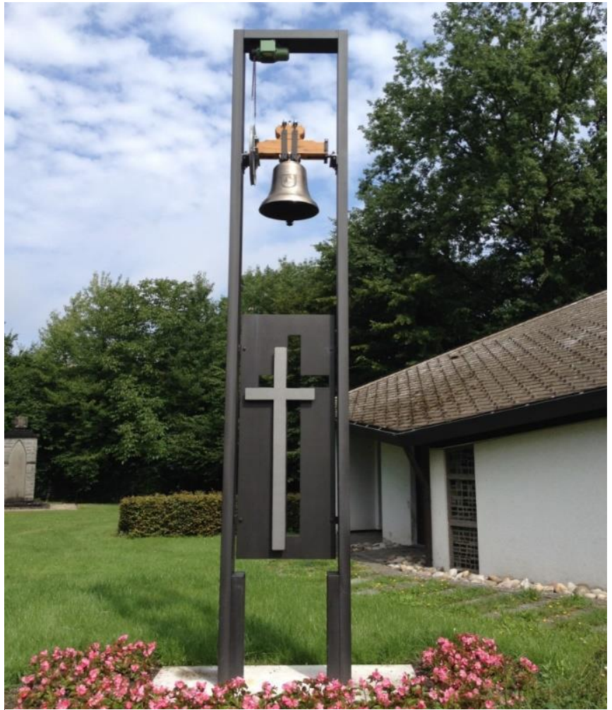
Beispiel eines Friedhof-Glockenturmes

Liebe Gemeindemitglieder, um Beerdigungen in einem noch würdigeren Rahmen gestalten zu können, werden die christlichen Kirchengemeinden Griesheims – auf ökumenischer Basis mit Hilfe der Stadt – auf unserem Friedhof einen Glockenturm neben der Trauerhalle verwirklichen. Die darin läutende Glocke soll den „Weg zur letzten Ruhestätte“ der Verstorbenen mit ihrem Klang begleiten und den Friedhofsbesuchern anzeigen, dass hier ein Mensch zu Grabe getragen wird. Denn seit alters her steht der Glockenklang als ein uns Menschen bekanntes Zeichen zum Innehalten.