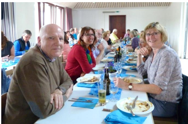
Nach reichhaltigem und schmackhaftem Essen gab es zufriedene Gesichter.